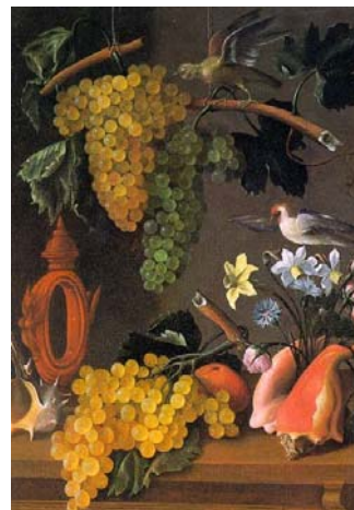
Immagini, da dipinti originali, in prima pagina di Abraham Bloemaert e in questa pagina di Juan de Espinosa, disponibili da WIKIMEDIA COMMONS, GNU Free Documentation License.